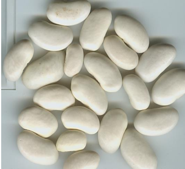
Fasule Krenare (Çerravë, Pogradec)