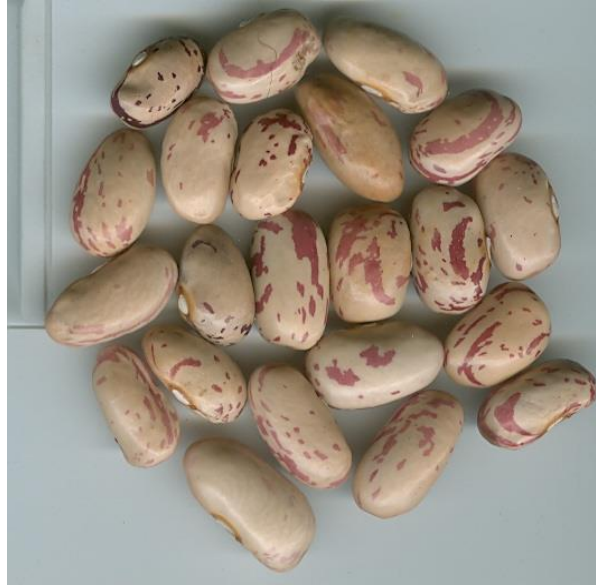
Fasule laramane (Munishtirë, Skrapar)

Fasulja e zakonshme dhe disa specie të tjera, që kultivohen në vendin tonë e kanë origjinën nga kjo vatër.