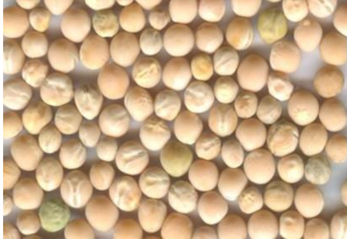
Bizele (Valias, Kamëz).

Qiqëra ( Cicer arietinum ), sipas De Candole, ka si vend-origjinë një zonë të gjerë midis Greqisë dhe Himalajeve (zonë që shpesh quhet Lindja), ndërsa Vavilov, raporton dy qendra origjine: Azinë Jug-Perëndimore me Mesdheun dhe Etiopinë. Grekët e kultivonin këtë specie që në kohën e Homerit, nën emrin “ erebinthos ”, Latinët me emrin “ cicer ”, që është origjina e të gjithë emrave modernë në jug të Evropës. Te shqiptarët, pasardhës të Pellazgëve, emri ekziston në formën “ kikere ”. Ekzistenca e emrave të tillë gjerësisht të ndryshëm tregon se bima ishte e njohur shumë herët, dhe ndoshta autoktone, në juglindje të Evropës. Në Turqi janë gjetur materiale që datojnë rreth 5500 p.e.s, ndërsa në Indi rreth 2000 vite p.e.s.