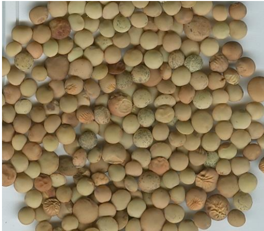
Thjerëz (Munishtirë, Skrapar).

pasardhës të Pellazgëve, e quanin “ pizelle ”, Latinët më vonë me emrin “ pisum ”. Mendohet se njerëzit kanë konsumuar bizele rreth 9500 vite më parë dhe kultivuar atë para 8500 vitesh.