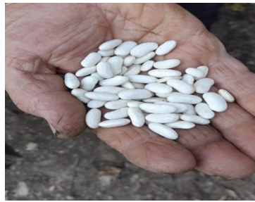
Phaseolus vulgaris L. (Trebisht)