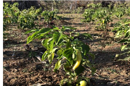
Capsicum annuum (Trebisht)