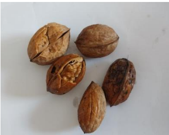
Juglans regia (Sebisht)