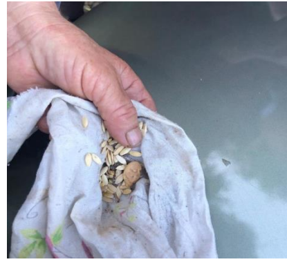
Cucumis sativus L. (Gizavesh)