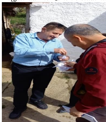
Capsicum annum ( Borovë)