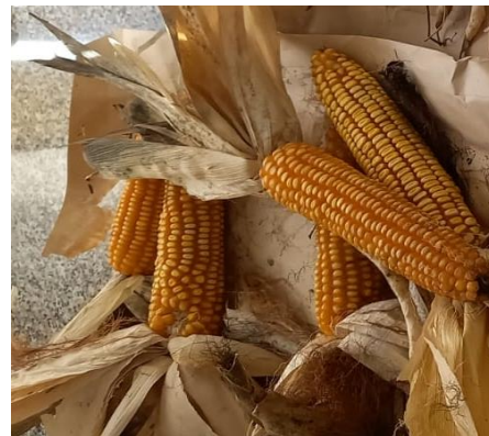
Zea mays L. (Fushë Studen)