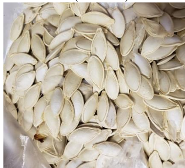
Cucurbita pepo L. (Orenjë)