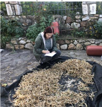
Phaseolus vulgaris L. (Funarës)