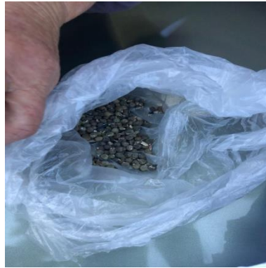
Abelmoschus esculentus (L.) (Qarrishtë)