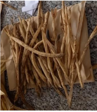
Phaseolus vulgaris L. (Borovë)