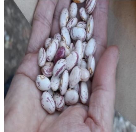
Phaseolus vulgaris L. (Trebisht)