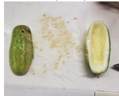
Cucumis sativus L. (Steblevë)