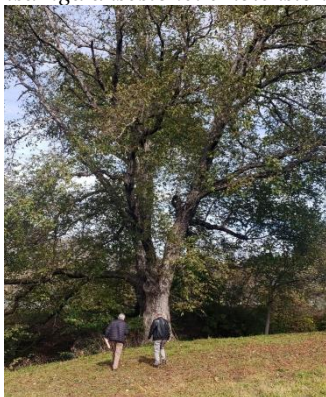
Juglans regia (Borovë)

Disa nga aksesionet e koleksionuar/rregjistruar në zonën e studimit